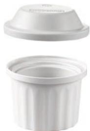
Cooling CUP Emmi Kühlbecher Artikel-Nr. 625042309

COOLING CUPS und Weckgläser von Berndorf Luzern AG