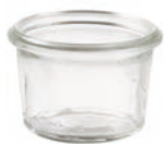
Weckglas ohne Deckel Sturzglas 80 ml im Set à 12 Stück Artikel-Nr. 8582.82370