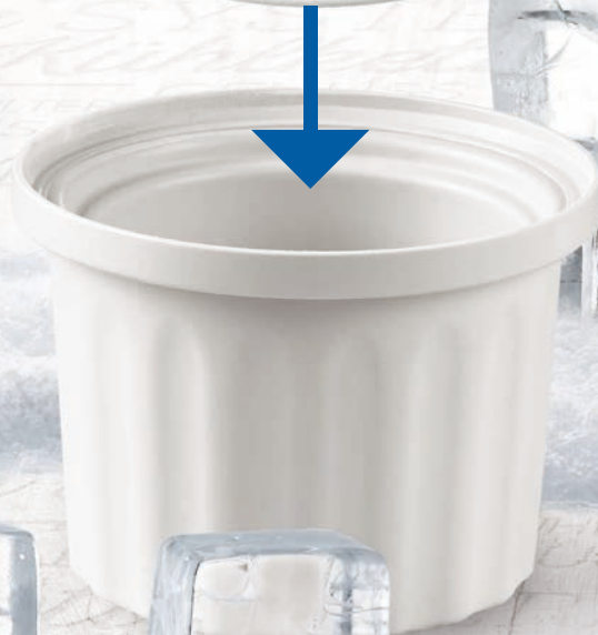
Temperaturentwicklung im Glace mit und ohne COOLINGCUP